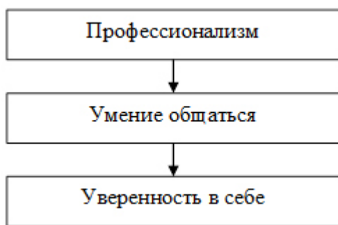
Рисунок 2 – Схема аксиологической системы современной педагогической культуры формирования установки на деловой успех в сфере спортивно-педагогической деятельности воспитательной направленности

Подчеркнем, что успех – это «лучший оратор в мире», он всегда располагает нас к тому, кто его добился (Ю. Лабрюйер). Подчеркнем также, что менеджмент в сфере воспитательной деятельности – это «управление, ориентированное на деловой успех» или: успех «тесно связан с дарованием и преданностью менеджеров воспитательных действий» [5]. Он связан также и с аналитической деятельностью, осуществляемой специалистами в сфере данной деятельности.